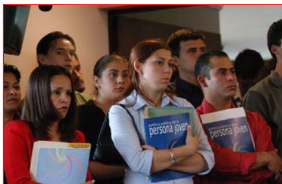
Jóvenes de la Asamblea en presentación de la Política Pública

Fuente: Sistema de Indicadores de la Persona Joven con base en la información de las EHPM del INEC