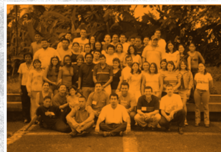
Consulta en la provincia de Limón (EARTH, Guápiles)