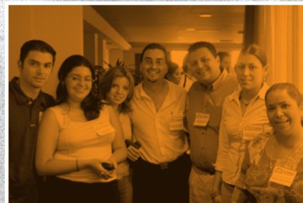
Asamblea General Consejo de la Persona Joven