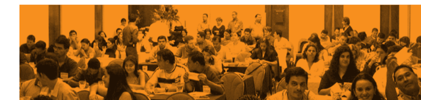
Consulta en la provincia de Limón (EARTH, Guápiles)