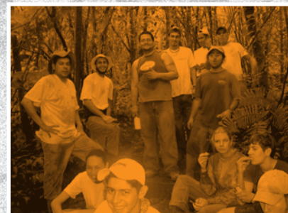
Voluntariado Consejo de la Persona Joven