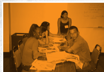
Consulta en la provincia de Limón (EARTH, Guápiles)

A continuación, se describen las principales particularidades de cada una de estas actividades.