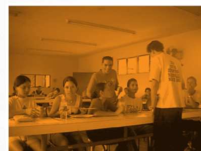
Consulta en la provincia de Cartago