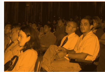
Asamblea General Consejo de la Persona Joven