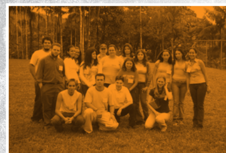
Consulta Región Huetar Norte (Santa Clara, San Carlos)