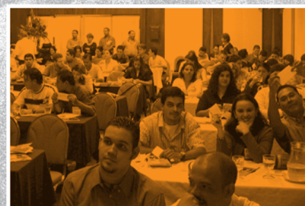
Asamblea General Consejo de la Persona Joven