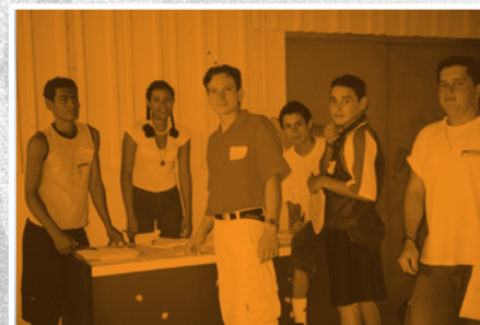
Consulta Región Huetar Norte (Santa Clara, San Carlos)

Para la construcción de la Política Pública de la Persona Joven, se fomentó e incentivó la participación social mediante la Consulta Nacional, mecanismo que posibilitó el involucramiento directo de personas jóvenes y diversos actores y sectores sociales interesados.