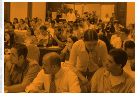
Asamblea General Consejo de la Persona Joven

a continuación se presenta una síntesis de los principales resultados del proceso de consulta del documento de Política Pública, los cuales se encuentran referidos a la cantidad total de participantes en las distintas actividades, a los elementos centrales que se constituyeron en insumos para realizar ajustes al documento, los productos obtenidos del proceso y la evaluación del mismo.