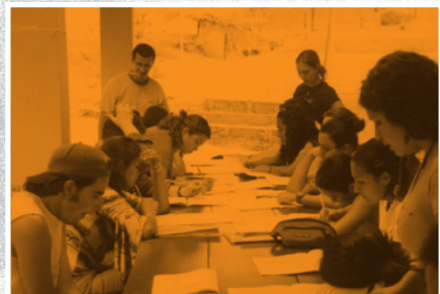
Consulta provincia de Guanacaste (Tilarán)

Desde el inicio, a partir de la aprobación de la Ley General de Juventud (No. 8261), en mayo del 2002, el Consejo Nacional de la Política Pública de la Persona Joven (CPJ), acatando sus mandatos, se dio a la tarea de elaborar la Política Pública de la Persona Joven (PPPJ), mediante un proceso de investigación y consulta tanto de la situación de las personas jóvenes del país, como del estado de la institucionalidad de la juventud en organismos gubernamentales, sociedad civil e instituciones del sector privado.