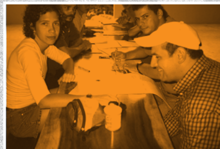
Consulta Región Huetar Norte (Santa Clara, San Carlos)