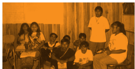
Consulta con grupo indígena (Buenos Aires)

Dichas guías serían entregadas a las y los participantes, junto con el documento preliminar de Política Pública, de manera previa a la realización de la actividad.