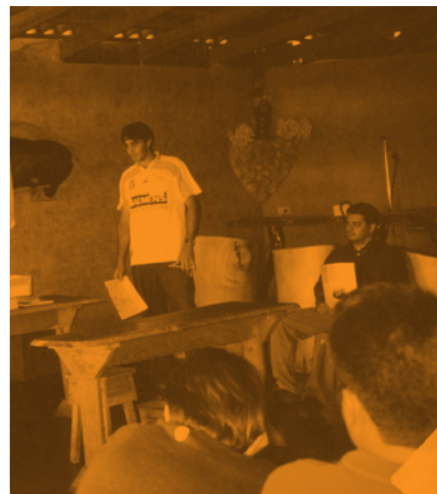
Consulta provincia de Guanacaste (Tilarán)