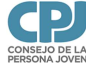
Imagen N°1. Proceso Consultivo Virtual a los Foros de Juventudes, 2021.