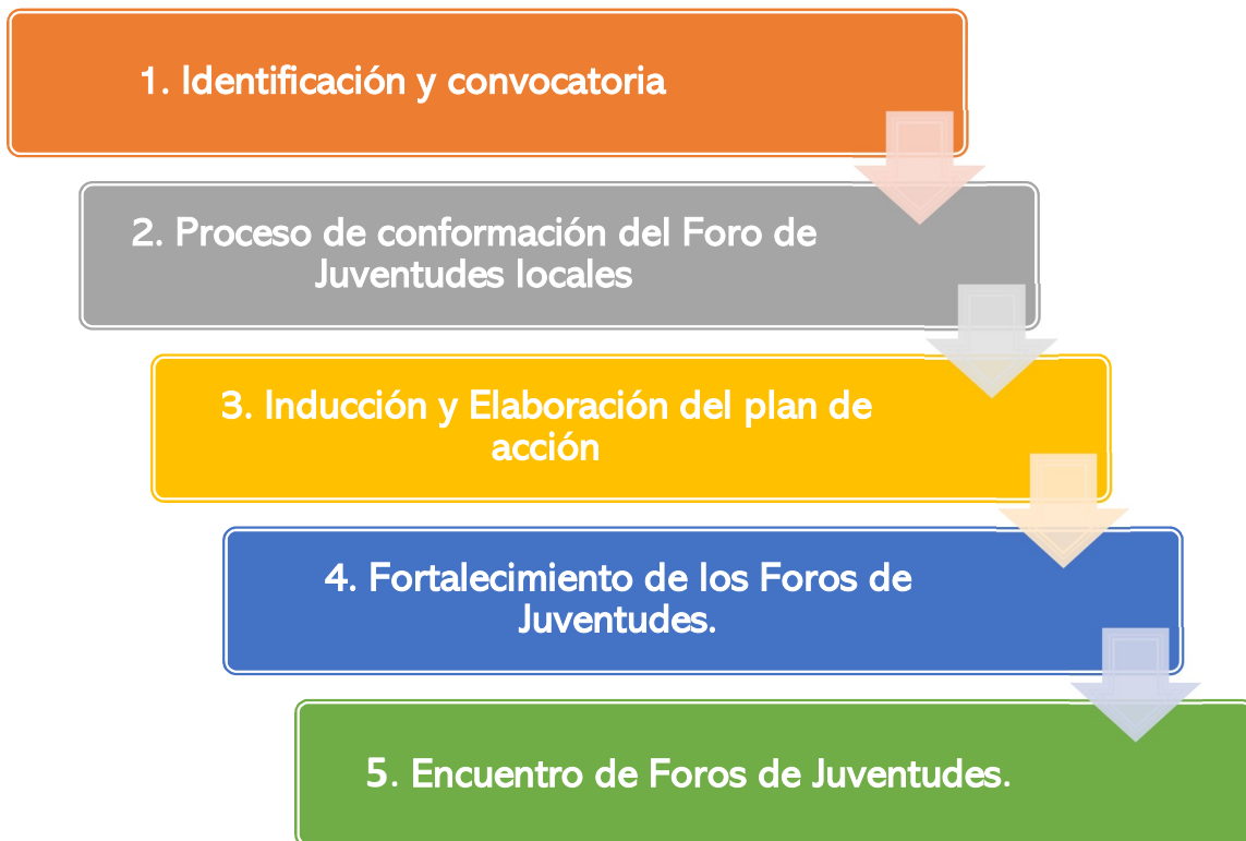
Imagen N°2. Fases de la conformación del FJ

Elaborado por: Gestores de Juventudes. 2021.